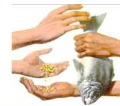
Lưu chuyển hàng hóa