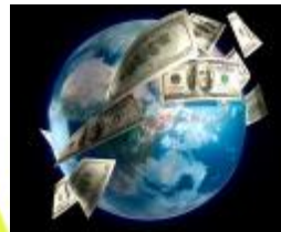
Lưu thông tiền tệ