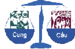
Cân bằng lượng cung cầu