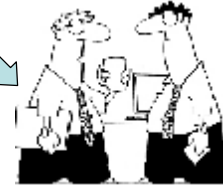
Thỏa mãn nhu cầu của người mua & người bán